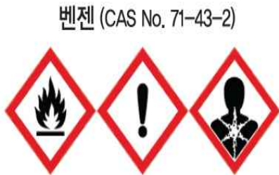
벤젠 (CAS No. 71-43-2)