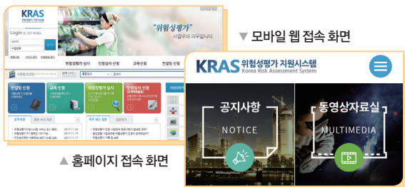
▲ 홈페이지 접속 화면