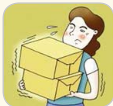
무리한 힘과 동작