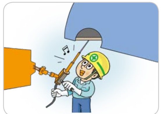
인체공학적 설비 개선