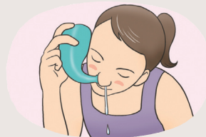
코를 자주 세척