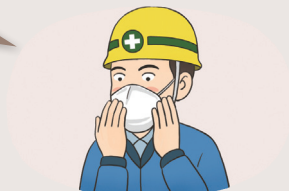
호흡용 보호구(황사 마스크 등)